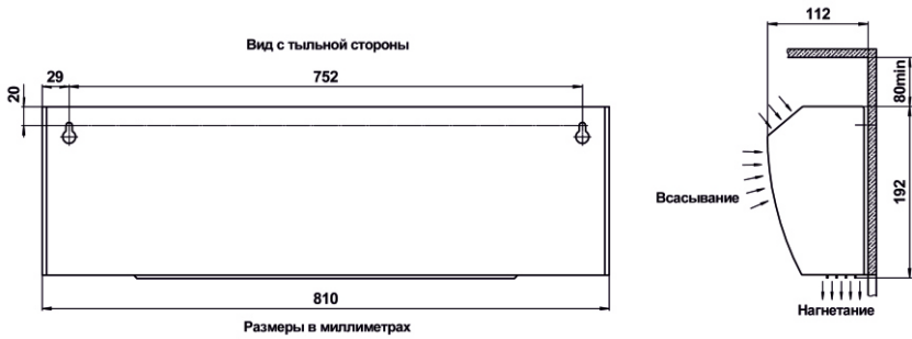
Рис. 2. Габаритные и установочные размеры